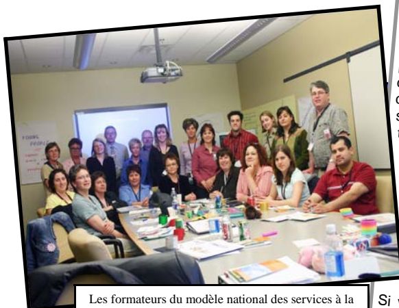
Les formateurs du modèle national des services à la jeunesse des FC à Ottawa en mai 2005