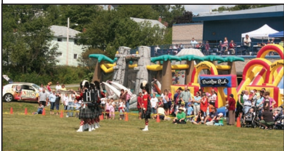
Légende : Des familles de militaires assistent au spectacle des 78 th Highlanders au Carnaval communautaire